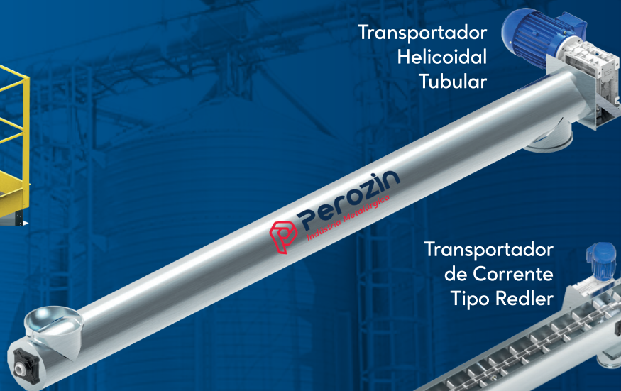
Transportador de Corrente Tipo Redler